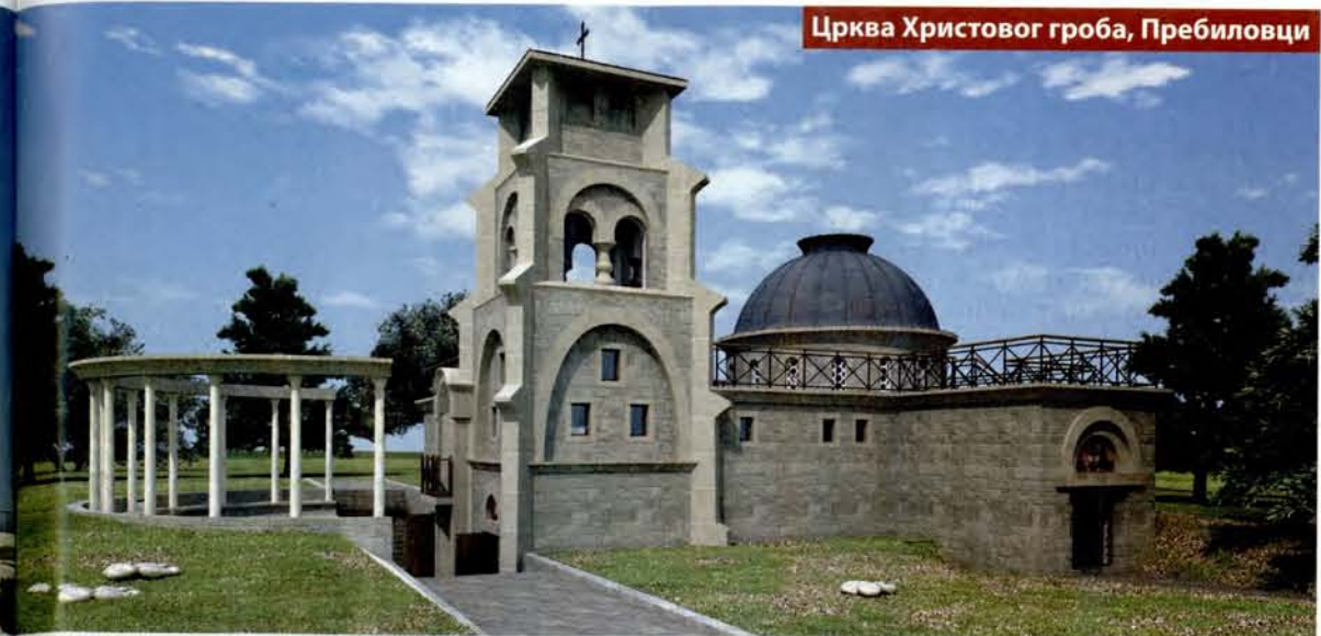
Црква Христовог гроба, Пребиловци

јавио да је на архитектури уведен пријемни испит, из математике и цртања. Из математике за десетак минута решио сам све за мене лаке и наивне задатке, и после једног сата досађивања предао рад. Био сам позван од проф. Радивоја Кашанина, јер сам једини у генерацији решио један проблем. Постављено питање је било без објашњења: A=B , а одговор је био B=A . Благодарећи проф. Кашанину карактеристика није имала дејство, код њега нису могли да прођу такозване „партизанске“ дипломе и Кашанин је спасао част БУ. Због свега изнетог такав факултет је за мене био нужно зло кроз које сам имао жељу само да се провучем. Било је то време ударника, а на обавезну праксу већ после прве године смо слани декретом. Ванпартијци су добијали забачену унутрашњост, а комунисти центар града. Изгледа да сам био вешт, па сам успевао и ту да се извучем. „Илегално“ сам терао по свом слободном избору, а то значи да сам се бавио свим и свачим, почев од спорта, па до биологије, физике, астрономије, до