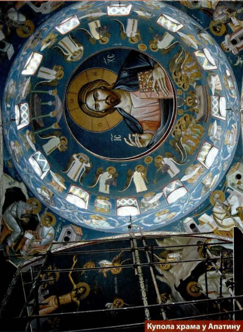
Купола храма у Апатину