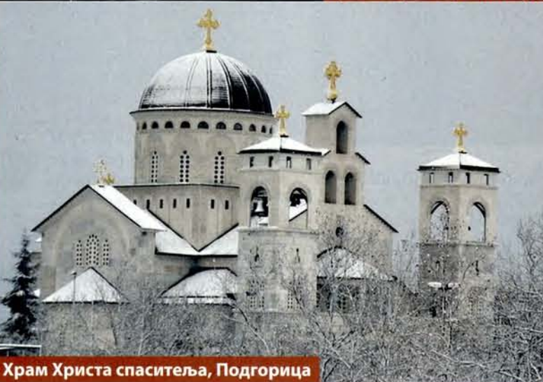
Храм Христа спаситеља, Подгорица