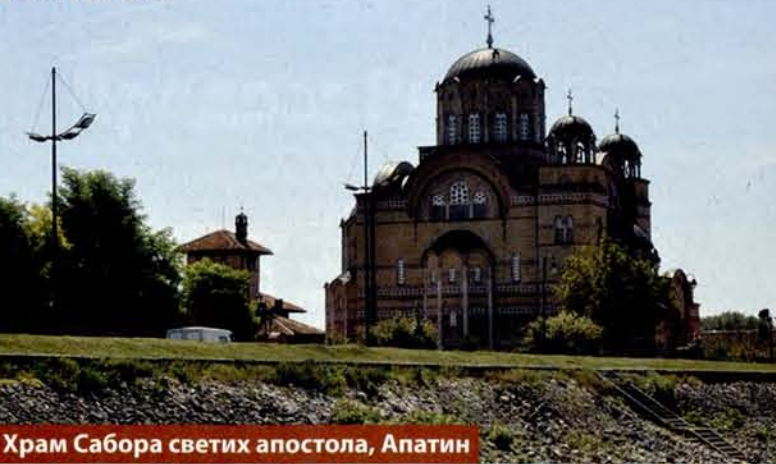
Храм Сабора светих апостола, Апатин