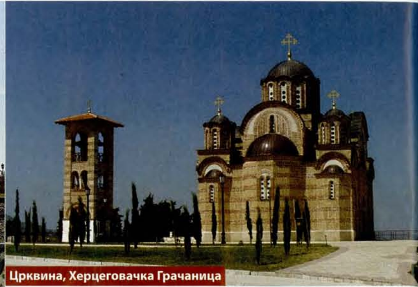
Црквина, Херцеговачка Грачаница